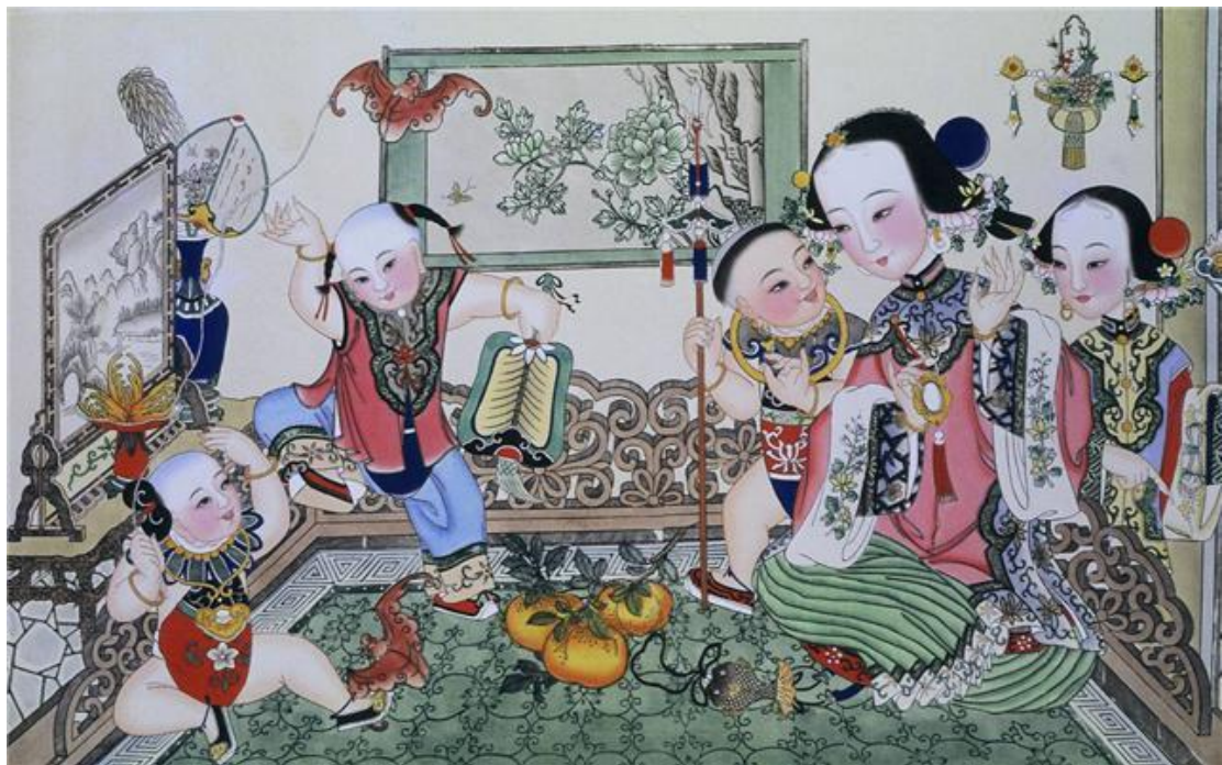
(杨柳青年画)